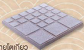
ลายไตเกียว