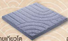
ลายเกียวโต