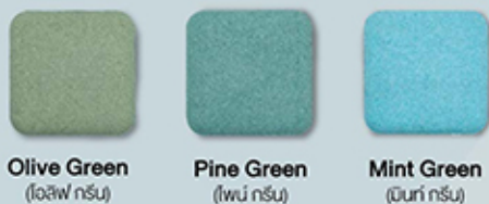
Olive Green (โอลิว กรีน) Pine Green (ไพน์ กรีน) Mint Green (มินท์ กรีน)